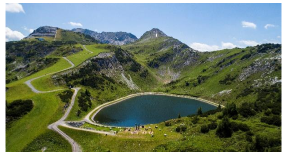
Seekarsee, Sesselbahn